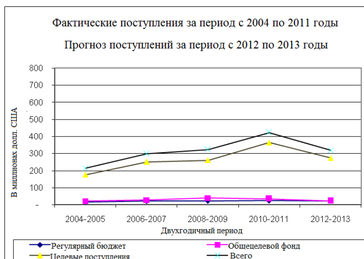
Рисунок 3. Тенденции поступления средств

99. В ходе осуществления этого стратегического плана ООН-Хабитат намерена значительно расширить свой портфель проектов и увеличить общий объем поступлений, тем самым обратив вспять снижение доходов, показанное на рисунке 3. Эта масштабная цель является средством для того, чтобы заставить организацию пересмотреть способы ведения хозяйственной деятельности, в том числе ее подход к партнерствам и к разработке новых проектов. Это является необходимым, учитывая масштаб и диапазон проблем, с которыми в настоящее время сталкиваются города.