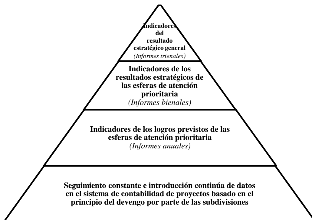
Gráfico 2. Indicadores de progreso

85. La aplicación del plan estratégico para 2014–2019 será objeto de un seguimiento sistemático para hacer una gestión eficaz del logro de resultados. Más concretamente, esto significa asegurarse de que los informes sobre los distintos niveles de indicadores del marco de resultados se presentan en el momento requerido (véase el gráfico 2). Las subdivisiones serán las principales responsables del seguimiento del plan, y contarán con la asistencia de las oficinas de los proyectos y las oficinas regionales. La Dependencia de Garantía de la Calidad, de la Oficina de Gestión, se encargará de la coordinación general de las actividades de seguimiento y presentación de informes.